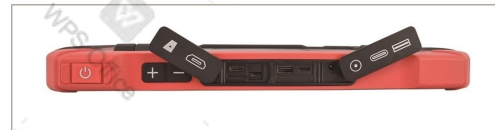
タイプC&A、DC IN、Micro SD、Mini HDMI