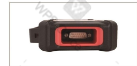
DB15 診断インターフェイス